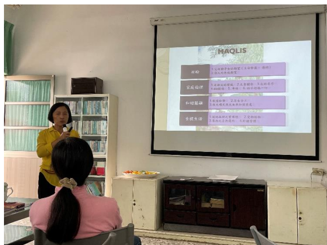
說明：解說部落家庭的運作模式。