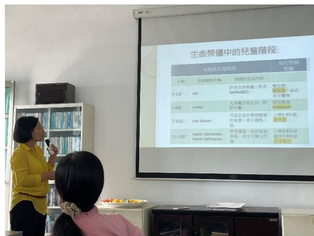
說明：解說部落兒童的每個學習階段。