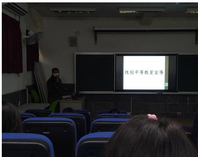
說明:性別平等教育宣導。