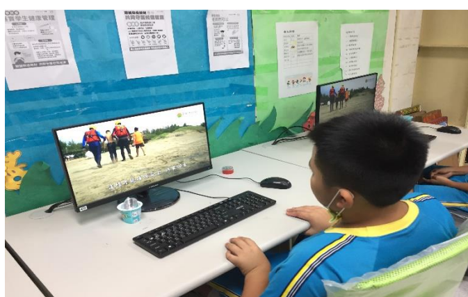
說明: 學生上網查性別平等多面化。