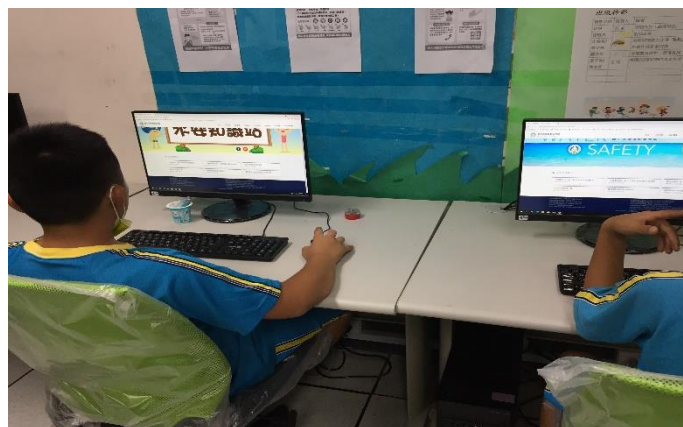
說明: 學生上網查性平定義。