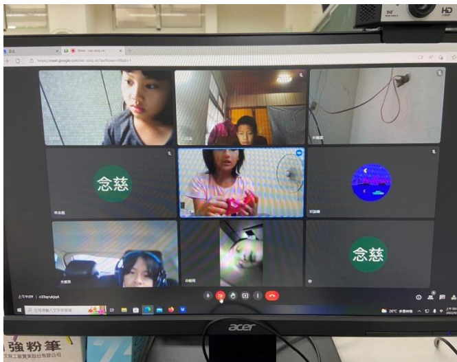
說明：中年級學習扶助。