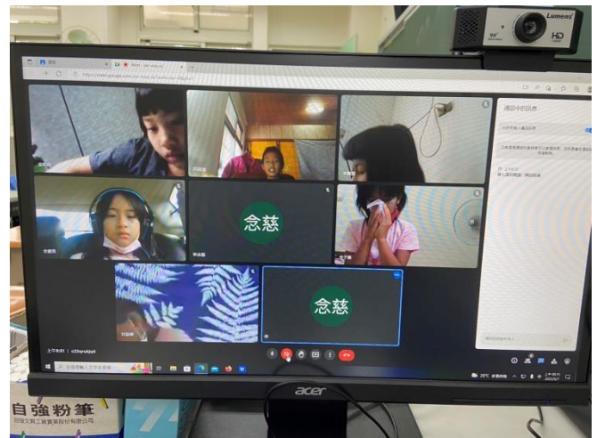
說明：中年級學習扶助。