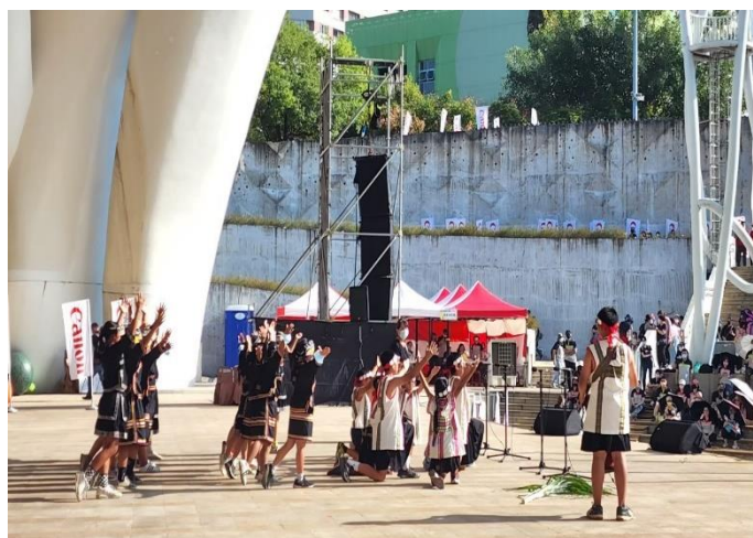
說明：現場布農歌謠表演。