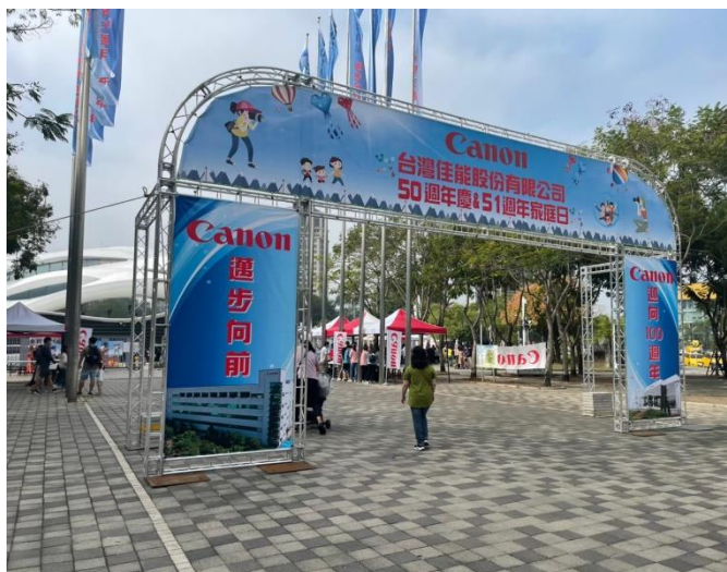
說明：台灣佳能親子日。