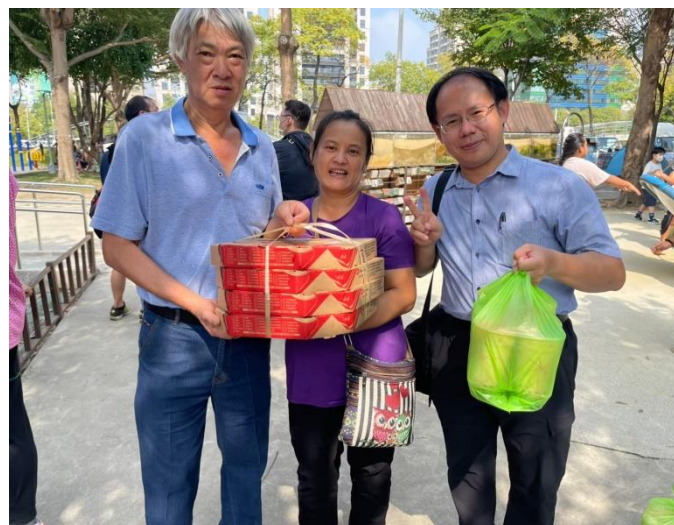
說明：家長送愛心給孩子。