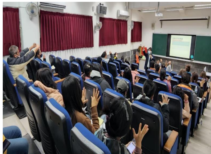
說明:教導主任跟家長作親師溝通。