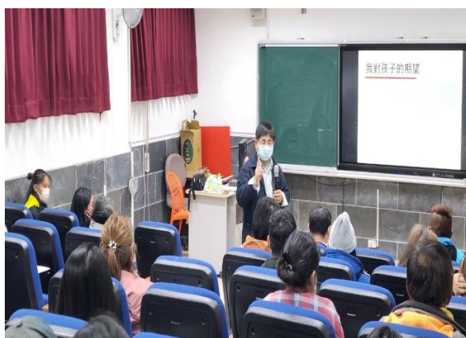
說明:家長會長表達家長們的想法。