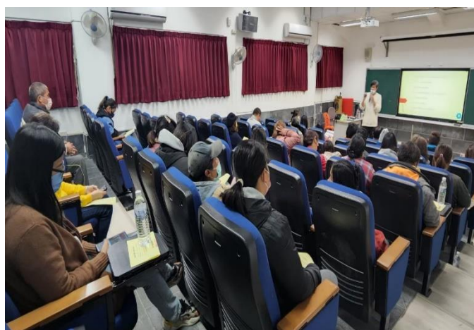
說明:學校向家長說明家庭教育發展方針。