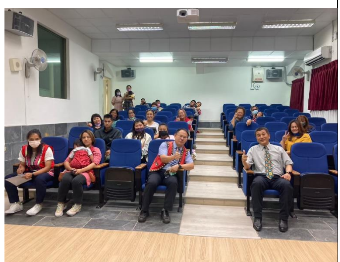
說明：學校跟家長合影。