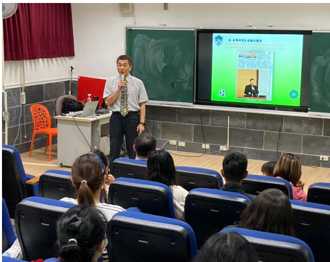
說明：每學期舉辦家長會暨班親會。