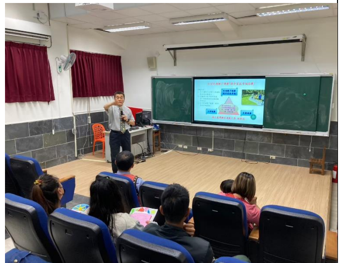
說明：家庭教育發展方針。