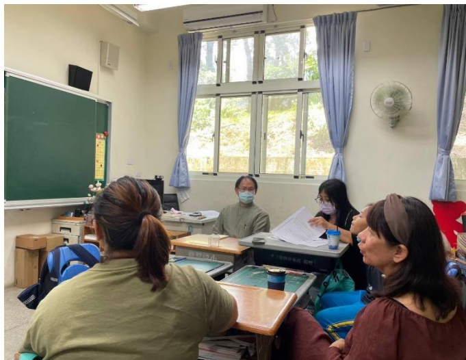
說明：導師分享個案在班上的學習狀況。