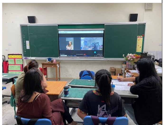
說明：學生分享自己的學習心得。