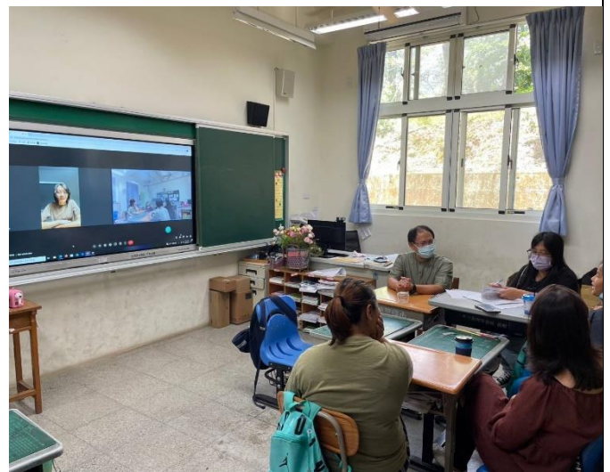
說明：家長說明個案在家的學習狀況。