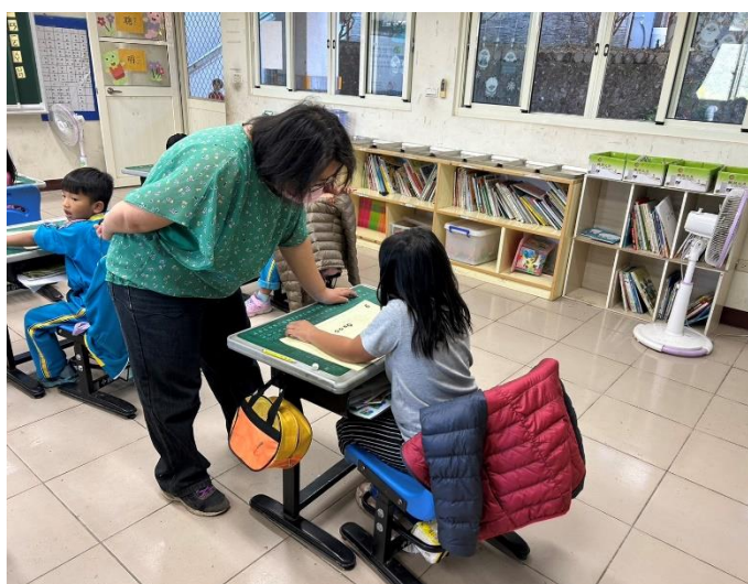
說明:一年級課後照顧。