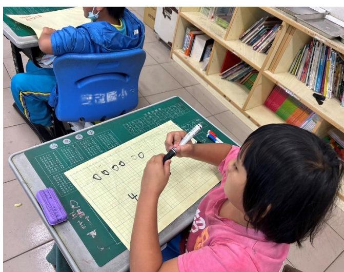
說明:一年級課後照顧。