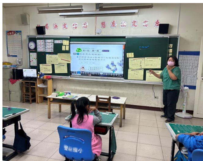
說明:課後照顧-數學。