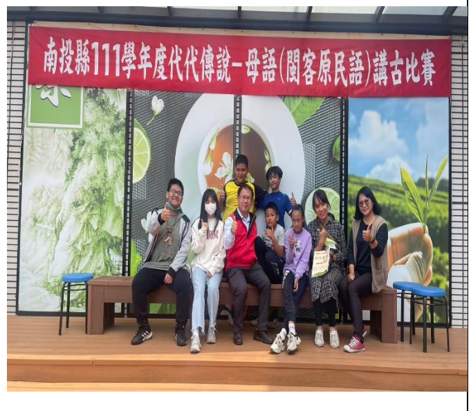
說明：家長觀看孩子的比賽。