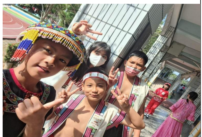
說明：學生事前比賽互相打氣。