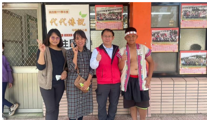
說明：學生參加族語比賽。