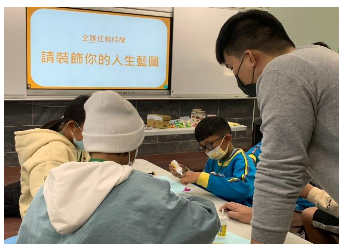
說明: 生涯的決定, 思考是否符合當初所期望的