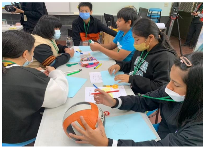
說明: 檢討自我的生活態度、價值觀。