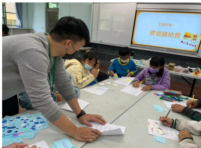
說明:認識生涯規劃的重要性。