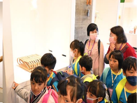
參觀竹山竹編工藝館