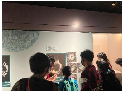
故宮遊藝思-學子嗨 FUN 參觀北部院區